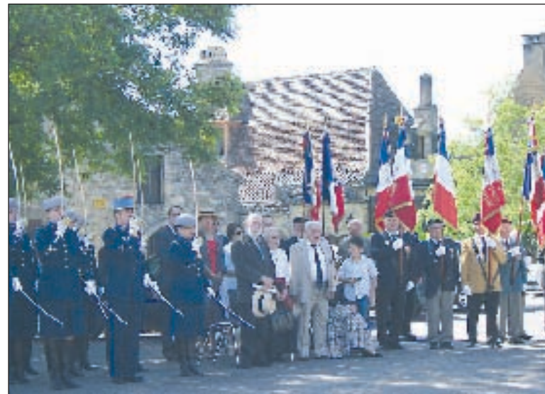
La famille du général Carmille au cours de la cérémonie