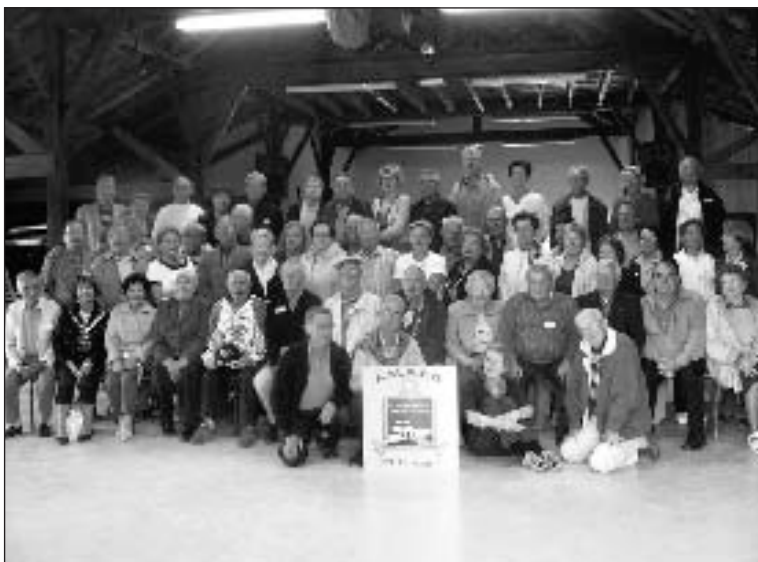
Traditionnelle photo souvenir