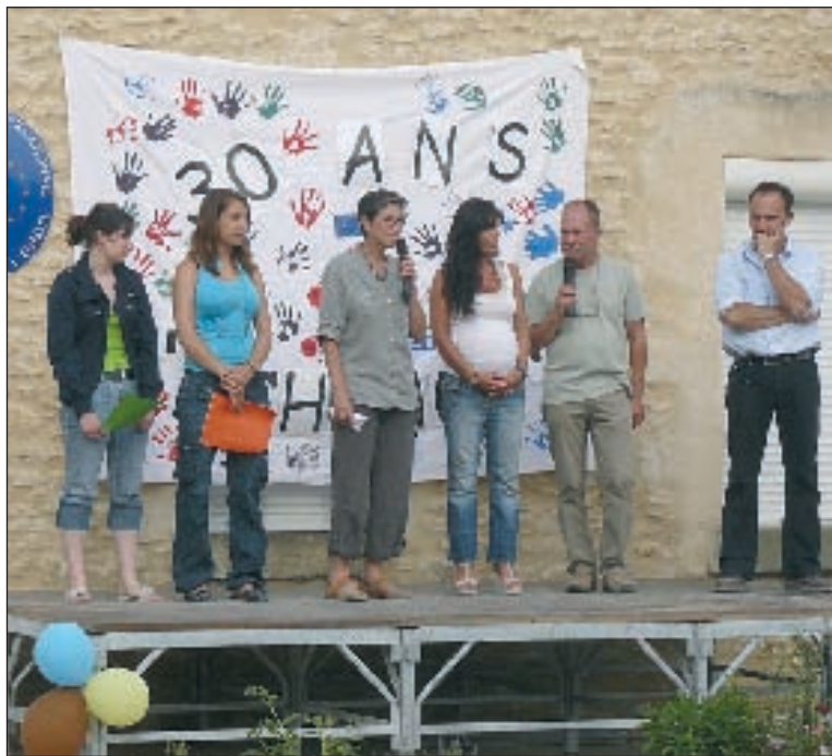
Trente années d'échange en quelques mots