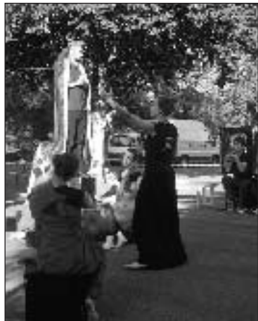
Des personnages étranges qui ont fasciné le public

Tout a commencé par du théâtre programmé par la communauté de communes dans le cadre de Jardins en scène, avec la pièce interprétée par la troupe bordelaise le Cri d'la Miette, " le Chat botté/saboté ", un spectacle drôle, décalé et original, quelque peu étrange et qui a reçu l'adhésion du public.